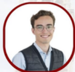
Charles Bekaert Public Relations - BM