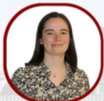
Aude Romain Competition Track - BM